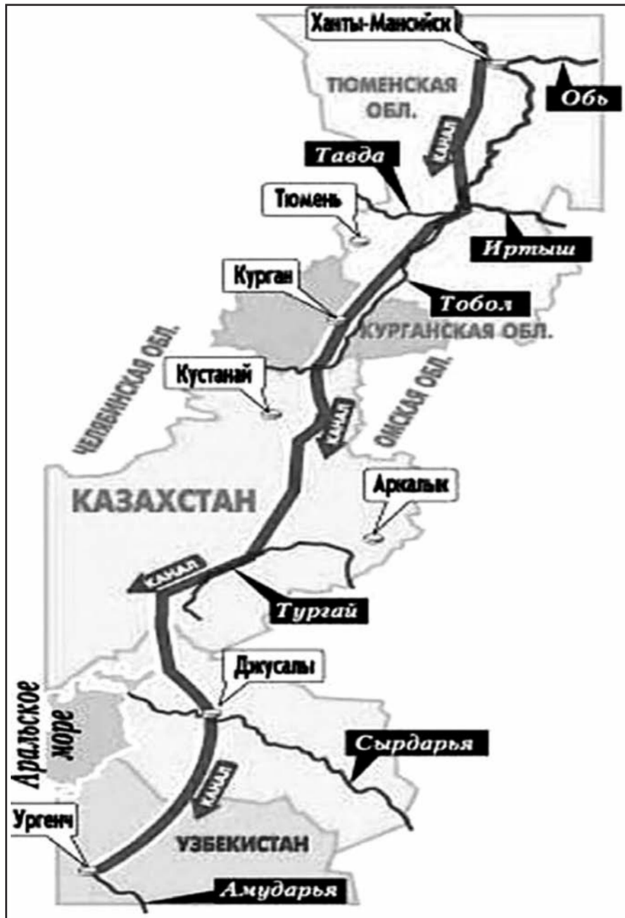
«СИБИРЬ – СРЕДНЯЯ АЗИЯ» Новый проект канала Проект предполагает прокладку канала длиной 2550 км по территории трёх государств (России, Казахстана и Узбекистана). Канал возьмёт начало от слияния Оби и Иртыша в районе Ханты-Мансийска, затем проследует вдоль русла Тобола и по Тургайской ложбине к Аральскому морю. Согласно проекту, ширина канала составит 200 м, глубина – 16 м. Считается, что канал позволит оросить страдающие от недостатка воды сельскохозяйственные земли в России (1,5 млн га), Казахстане и Средней Азии (2 млн га). Ежегодно области будут получать 4,9 км³, Северный Казахстан – 3,4 км³, Сырдарья и Амударья – 16,3 км³